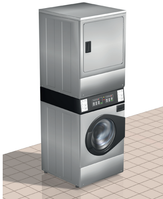
Pesutorni Talpet CS 10 - suuri kapasiteetti ja pieni tilantarve.